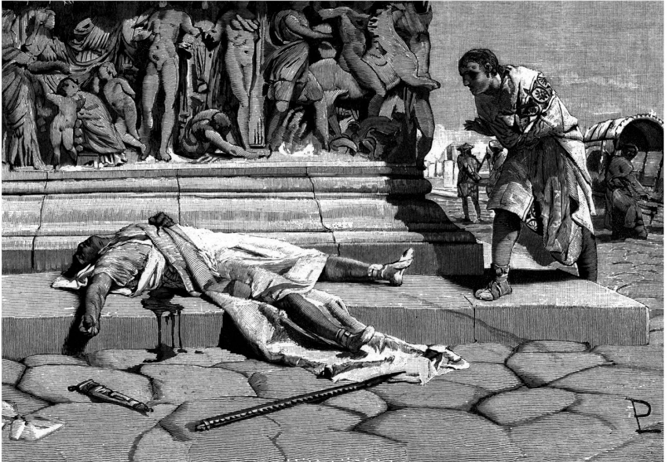
Den mördade Publius Clodius Pulcher när han hittades på Via Appia. Illustration från ca 1909, okänd konstnär, via Wikimedia Commons. Public domain.

Cicero. Slutet för Clodius blev blodigt: han mördades av en politisk motståndares hejdukar år 52 f.Kr.