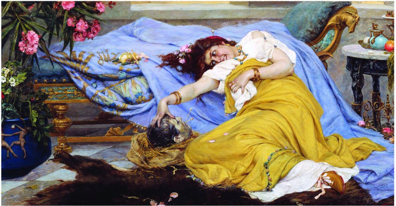
Fulvia med Ciceros huvud. Oljemålning av Pavel Svedomsky från 1898.

Det gjorde inte Fulvia. Öppet tog hon ställning, både för sin förste make Clodius och för Marcus Antonius. Hon lät visa upp den döde Clodius misshandlade kropp – och hetsade förmodligen därigenom hans anhängare till våld. Och hon gick ytterligare ett steg längre när hon lät värva soldater åt Marcus Antonius. Sådant gjorde inte en kvinna ostraffat.